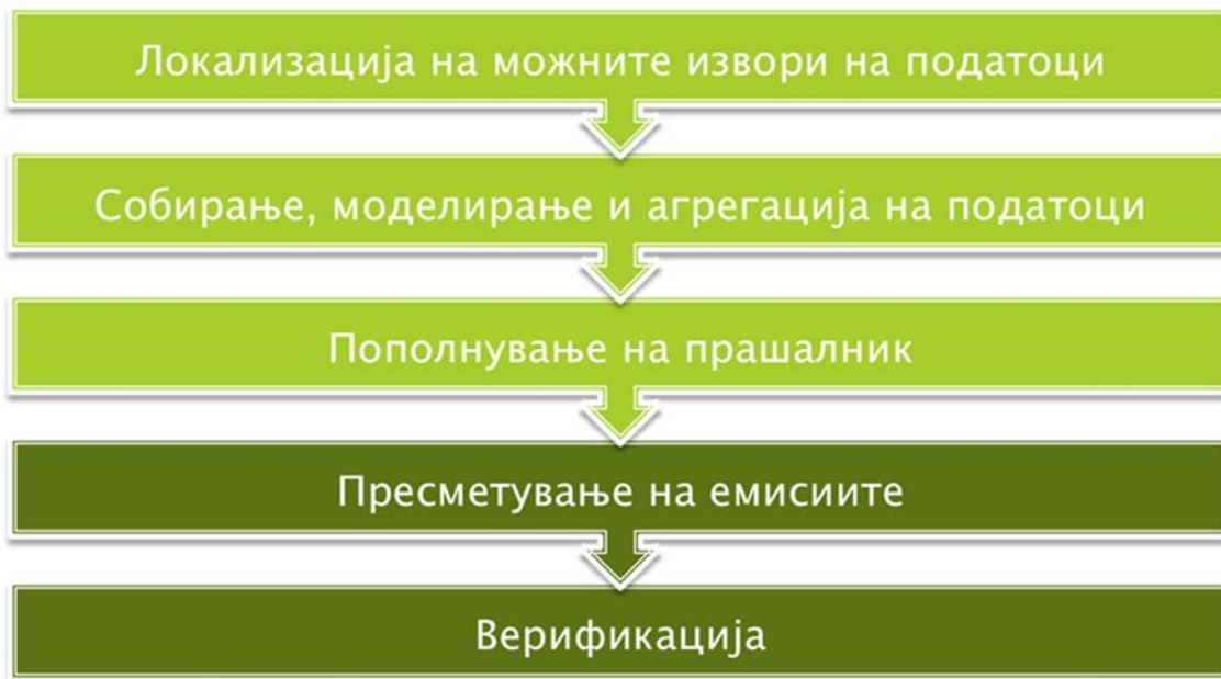
Слика 1. Визуелен приказ на подготовката на инвентарот

Податоците за изработка на инвентарите беа собрани преку прашалници кои беа доставени до општината. Исто така, беа доставени и официјални барања до други ентитети од јавниот сектор како и до приватниот сектор. Понатаму инвентарот се изработи во креираната алатка (во MS Excel) во рамките на проектот на УСАИД „Општински стратегии за климатски промени“ во која беа предефинирани емисионите фактори за секој вид на активност во општината.