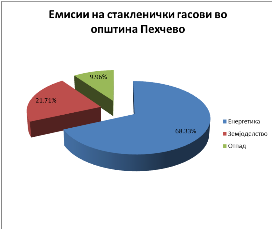
Слика 3. Процентуална застапеност на емисиите на стакленички гасови во Општина Пехчево