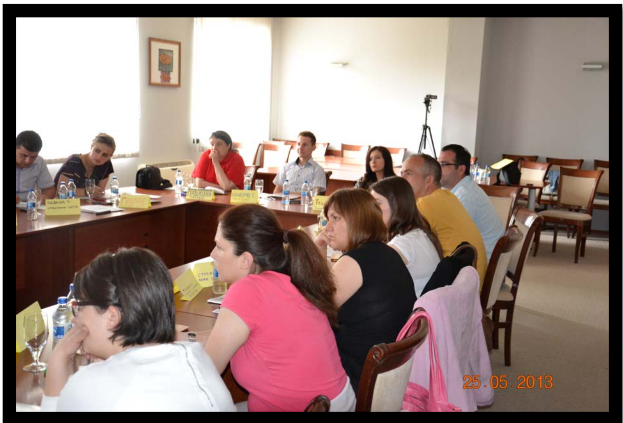
Слика 1. Работилница за подготовка на инвентар на стакленички гасови во Велес, 25.05.2013

Во рамките на проектот на УСАИД „Општински стратегии за климатски промени“ спроведуван од Милиеуконтант Македонија, беше воведена и фаза на едукација на претставниците на општините, за подготовка на инвентар на стакленички гасови. Едукацијата беше изведена преку тренинг сесии на претставниците од општината и невладините организации кои го координираа процесот на „Зелена агенда“ во општината. Процесот на едукација понатаму продолжи преку пренесување на знаењето во локалните работни групи кои беа задолжени за собирање на податоци.