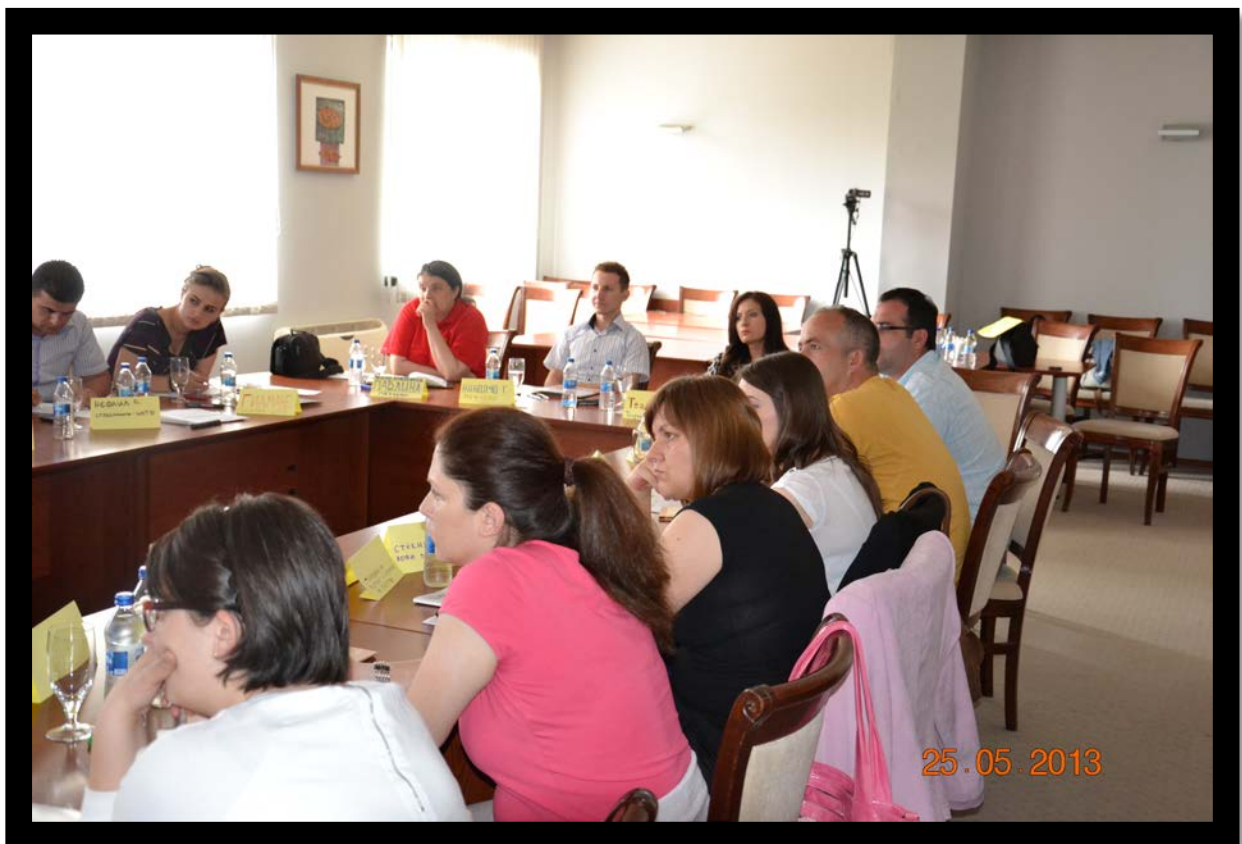
Слика 1. Работилница за подготовка на инвентар на стакленички гасови во Велес, 25.05.2013

Во рамките на проектот на УСАИД „Општински стратегии за климатски промени“ спроведуван од Милиеуконтант Македонија беше воведена и фаза на едукација на претсавниците на општините за подготовка на инвентари на стакленички гасови. Едукацијата беше изведена преку тренинг сесии на претставниците од општината и невладините организации кои го координираа процесот на „Зелена агенда“ во општината. Процесот на едукација понатаму продолжи преку пренесување на знаењето во локалните работни групи кои беа задолжени за собирање на податоци.