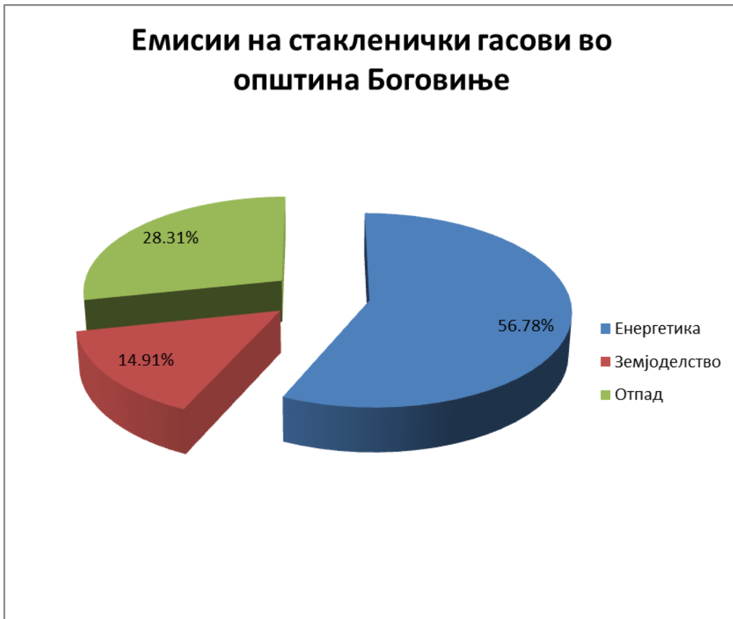
Слика 3. Процентуална застапеност на емисиите на стакленички гасови во Општина Боговиње