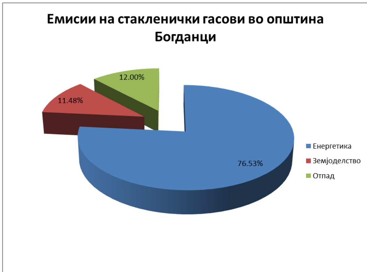
Слика 3. Процентуална застапеност на емисиите на стакленички гасови во Општина Богданци