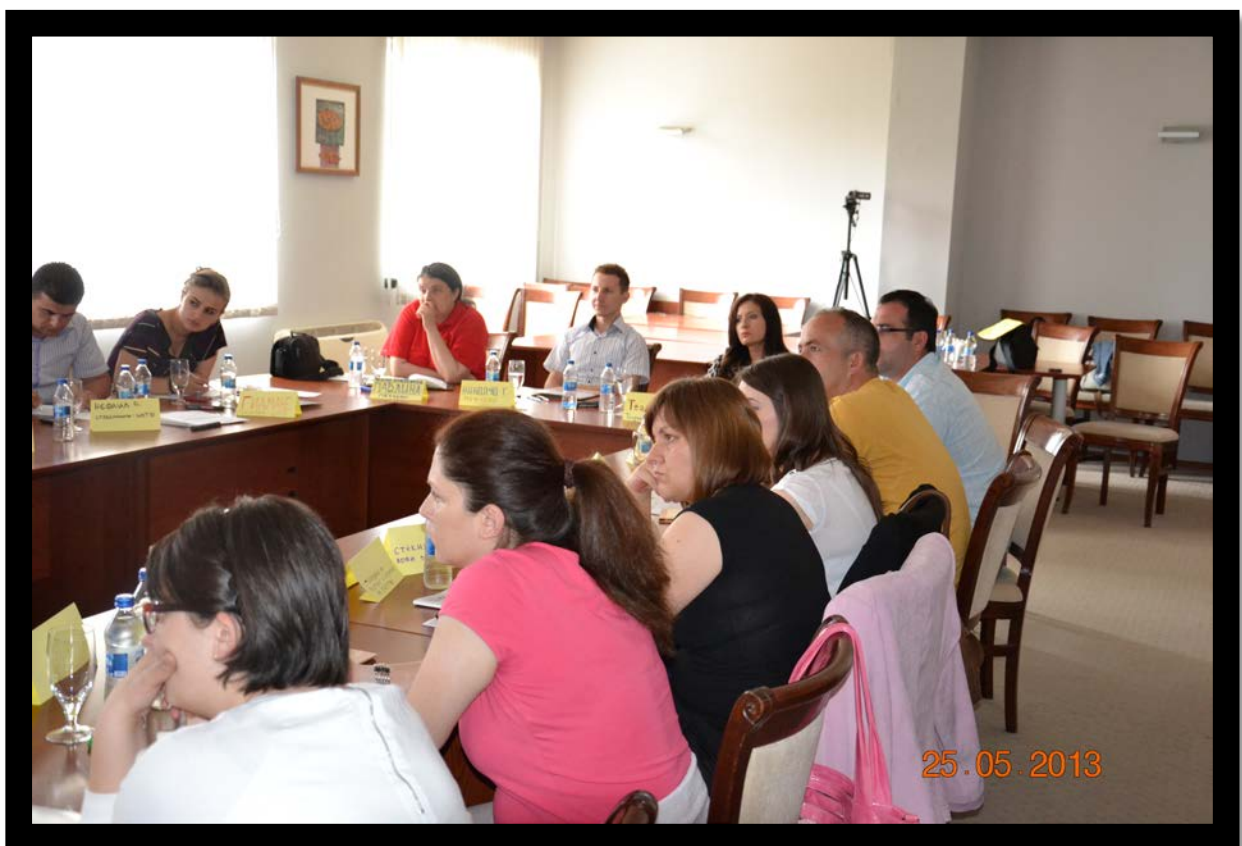
Слика 1. Работилница за подготовка на инвентар на стакленички гасови во Велес, 25.05.2013

Во рамките на проектот на УСАИД „Општински стратегии за климатски промени“ спроведуван од Милиеуконтант Македонија, беше воведена и фаза на едукација на претставниците на општините, за подготовка на инвентар на стакленички гасови. Едукацијата беше изведена преку тренинг сесии на претставниците од општината и невладините организации кои го координираа процесот на „Зелена агенда“ во општината. Процесот на едукација понатаму продолжи преку пренесување на знаењето во локалните работни групи кои беа задолжени за собирање на податоци.